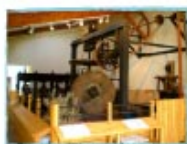
huilerie de l'écomusée