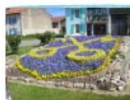
blason de la commune