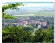
point de vue

vous adressent leurs meilleurs vœux, pour cette nouvelle année.